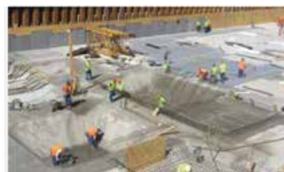
Application sous le plancher

Pour les instructions complètes, veuillez consulter le manuel d'application VOLTEX®.