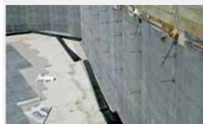
Installation en vertical