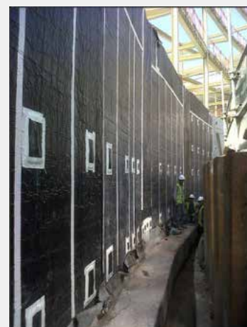
Application sur un mur