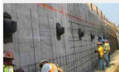
Installation en vertical